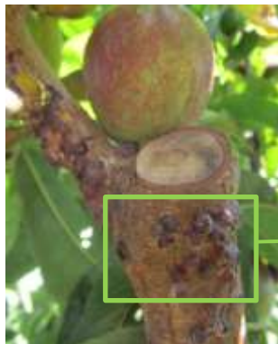
Présence de boucliers sur rameau

Évaluation du risque : le risque est élevé lors de l'essaimage dans les vergers ayant d'importants foyers.