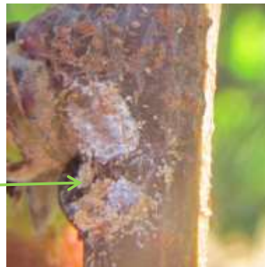
Premières larves sous les boucliers