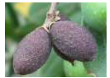
Photo 1 : chute physiologique

On estime qu'un stade est atteint lorsque plus de 50% des organes végétatifs répondent à sa définition.