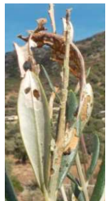
Ci-contre photo 4 : dégâts sur rameau provoqués par la chenille

Évaluation du risque : moyen, les températures estivales sont défavorables à son activité ; surveiller uniquement sur jeunes arbres .