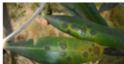
Photo 2 : Taches symptomatiques des contaminations dues au champignon F. oleagineum

Observations : surveiller l'apparition sur les feuilles âgées de taches dues aux contaminations du printemps précédent.