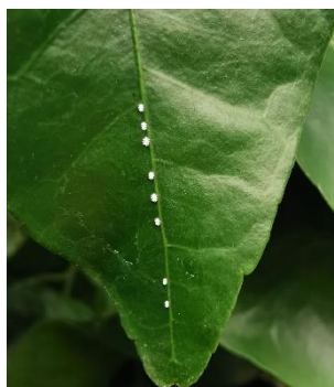
Photo 4 : Essaimage de cochenille chinoise sur la nervure centrale

Gestion du risque : La taille annuelle et l'ébourgeonnage, qui aèrent les arbres, sont des pratiques indispensables en cas de problèmes de cochenilles. Il est possible d'utiliser des produits de biocontrôle pour freiner la progression du nuisible.