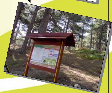
Équipement des massifs : cuves, zones d'appui à la lutte (ZAL), pistes

Depuis plusieurs années, la priorité est accordée à la surveillance terrestre, notamment armée, qui représente près de 40 % des aides, devant les travaux sur les équipements DFCI (env. 30 %), l'aide à l'acquisition de véhicules de surveillance et matériels de travaux et le contrôle de la réglementation avec un effort sur les OLD notamment.