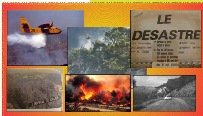
Incendies dramatiques de l'été 1986 dont l'ampleur a débouché sur la création de la DPFM

La Délégation à la protection de la forêt méditerranéenne est le service du préfet de zone chargé de mettre en œuvre les missions correspondantes ; il s'agit d'animer et de coordonner l'action des services de l'État dans les 15 départements méditerranéens : Alpes-de-Haute-Provence, Hautes-Alpes, Alpes-Maritimes, Ardèche, Aude, Bouches-du-Rhône, Corse-du-Sud , Haute-Corse , Drôme, Gard, Hérault, Lozère, Pyrénées-Orientales, Var, Vaucluse, dans le domaine de la prévention des incendies de forêts .