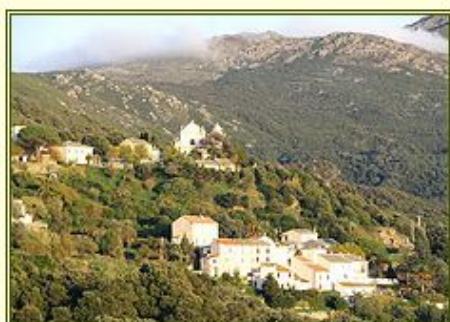
Un hameau entouré d'un couvert végétal dense

En Corse, depuis les années 90, les services et opérateurs de l'Etat (DDAF et ONF) travaillent à son application. Depuis 2006, l'Office de l'environnement de la Corse s'est doté d'un service de 9 agents de débroussaillage, dont le rôle consiste à apporter aux maires un appui technique et administratif.